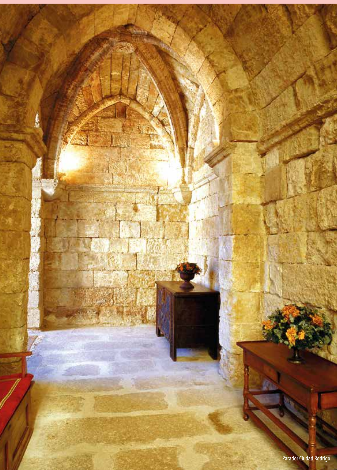
Parador Ciudad Rodrigo