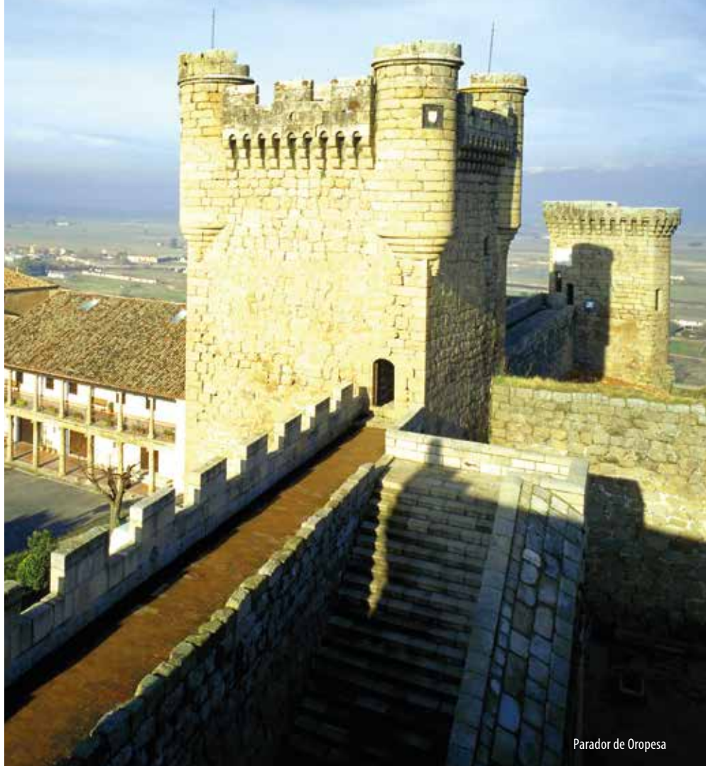
Parador de Oropesa